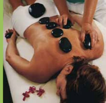
Il massaggio con le pietre è una delle terapie più antiche in quanto è istintivo nell'uomo avere il riflesso di fare pressione sulla parte dolorante.