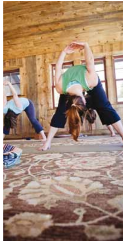
L'accoglienza degli spazi è importante per accrescere la sensazione di benessere.

Chi gestisce questi luoghi lo sa molto bene: la cura di sé comincia fuori da sé, nell'attenzione per la terra, l'ambiente, i materiali, e i particolari del paesaggio. Sarà che quando uno è attento a ciò che